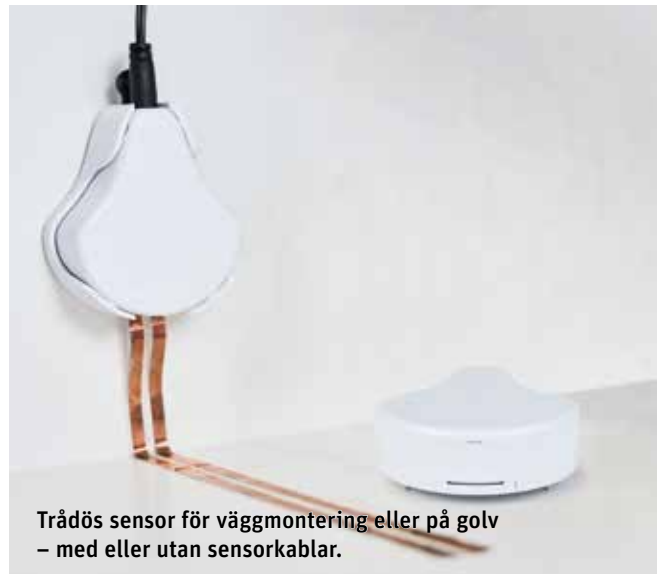
Trådlös sensor för väggmontering eller på golv – med eller utan sensorkablar.