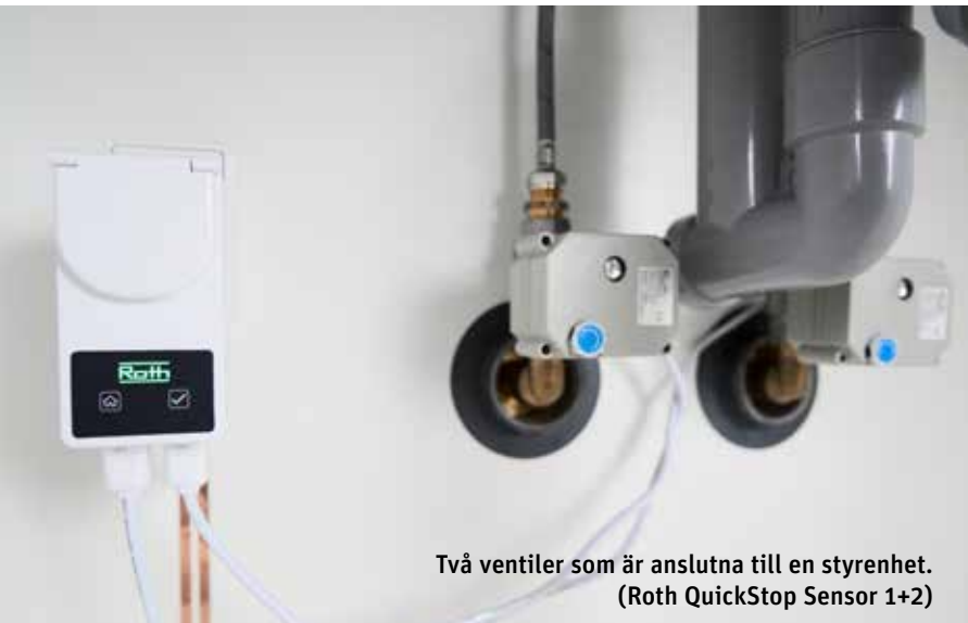
Två ventiler som är anslutna till en styrenhet. (Roth QuickStop Sensor 1+2)