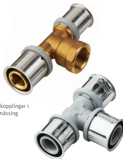
Presskopplingar i DZR mässing